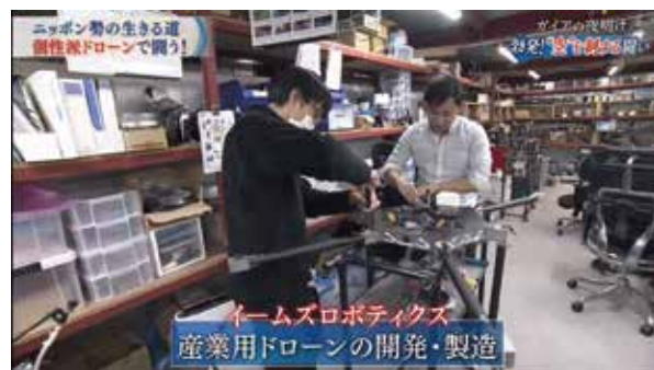
2021年1月26日 テレビ東京「ガイアの夜明け」にて弊社の取り組みが紹介されました